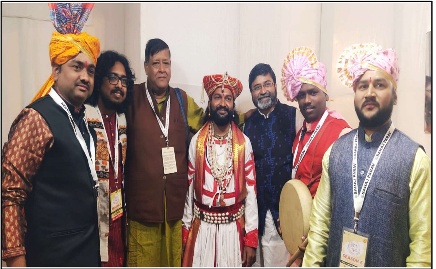
(KOLKATA 2024 – ROOT MUSIC FESTIVAL)