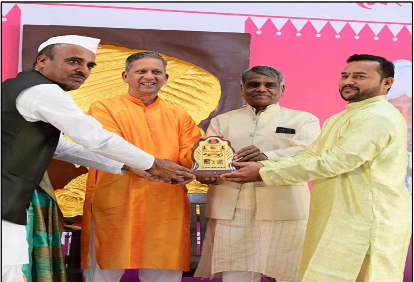
(PUNE ALANDI -2022 – CLASSICAL MUSIC WITH HARMONIUM CONCERT)