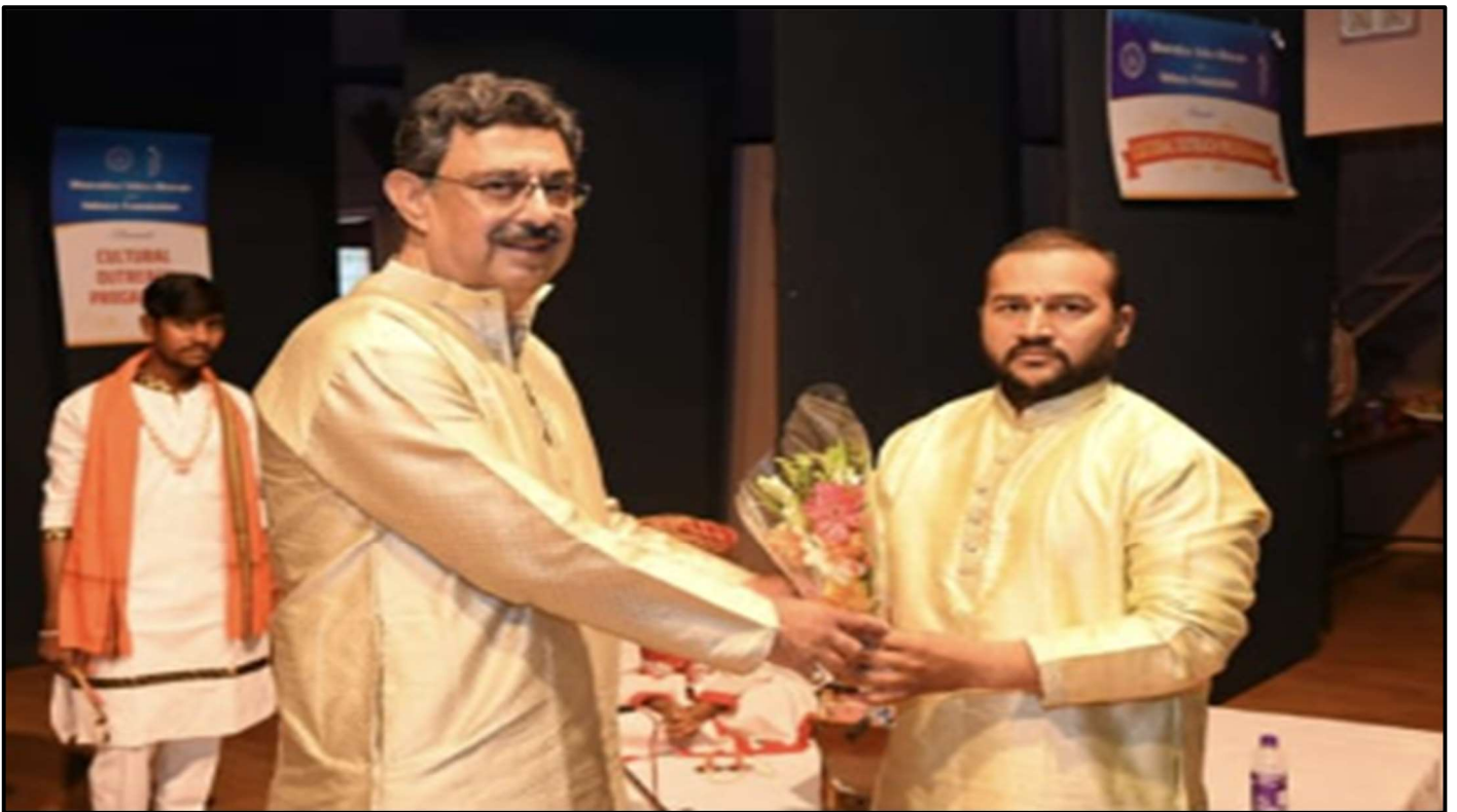
(PUNE JULY 2023 – BHARTI VIDHYABHAVAN-MAHARASHTRA TRADITIONAL FOLK)