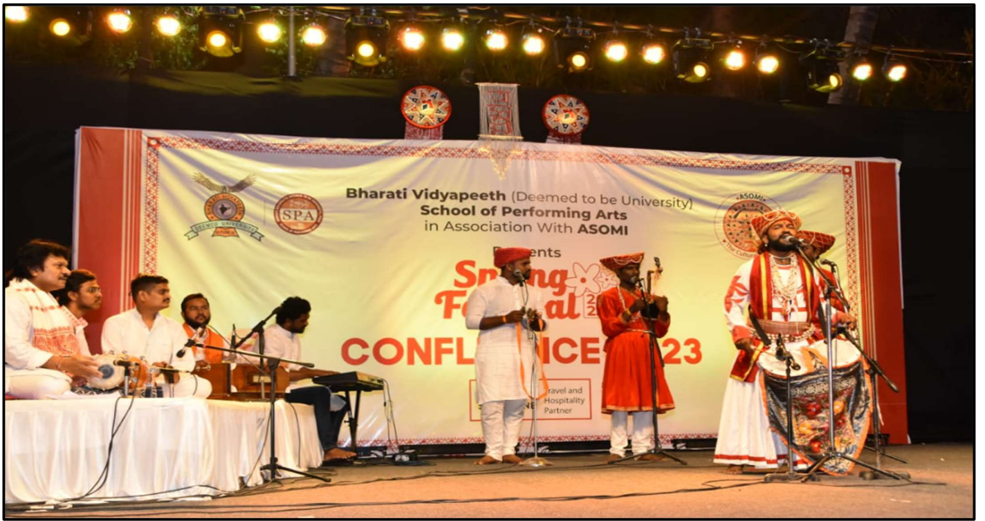
(PUNE- APRIL 2023 – BHARTI VIDHYAPEETH-MAHARASHTRA TRADITIONAL FOLK)